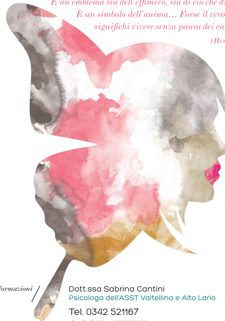
illustrazione e grafica / MARCO BERTON